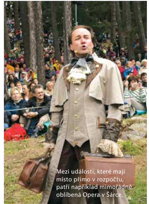
Mezi události, které mají místo přímo v rozpočtu, patří například mimořádně oblíbená Opera v Šárce.

Samostatnou kapitolou jsou Farmářské trhy, v jejichž rámci se prezentují partnerská města Prahy 6 a od roku 2016 se tu koná také mi-