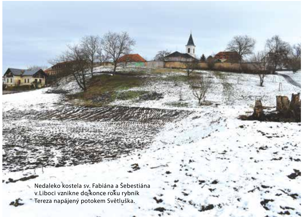
Nedaleko kostela sv. Fabiána a Šebestiána v Liboci vznikne do konce roku rybník Tereza napájený potokem Světluška.

Po vyčištění celé plochy byl na svazích pod kostelem vysázen třešňový sad z historických pražských odrůd a vyseta speciální směs pro květnaté louky. Ve svahu byly v létě vybudovány kamenné zidky, kolem kterých povedou pěšiny a stezky. Část plochy podél zdi obory zůstává na žádost Prahy 6 volná, aby zde mohla vzniknout komunitní zahrada. Celkově zde