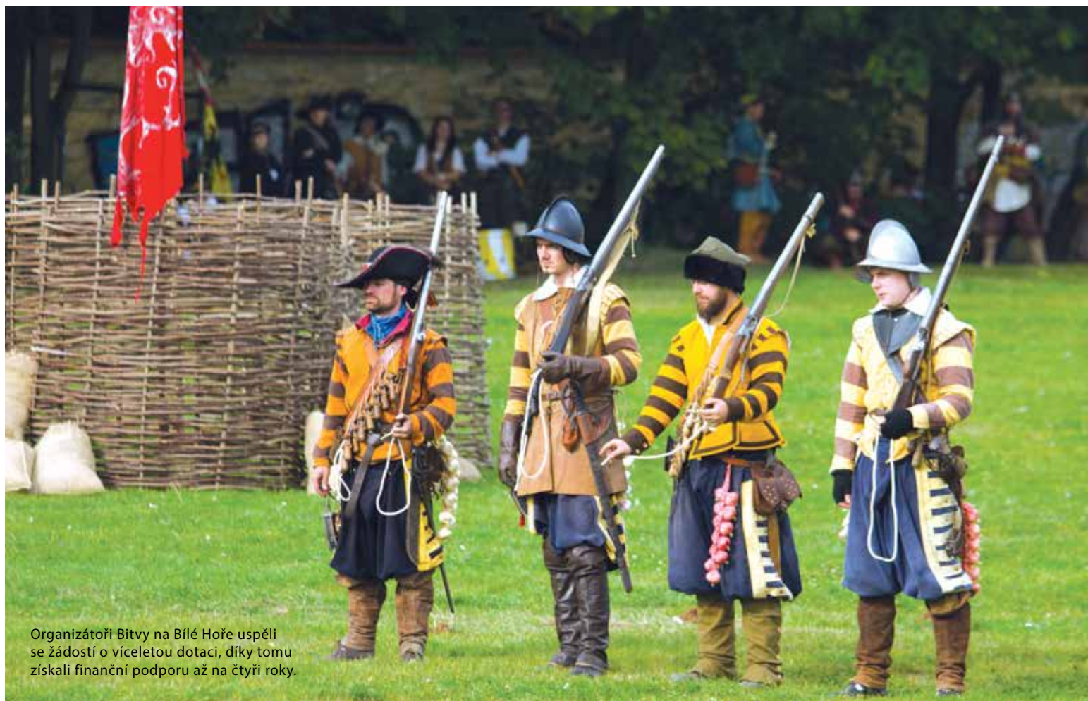
Organizátoři Bitvy na Bílé Hoře uspěli se žádostí o víceletou dotaci, díky tomu získali finanční podporu až na čtyři roky.